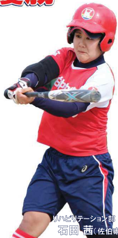
リハビリテーション部